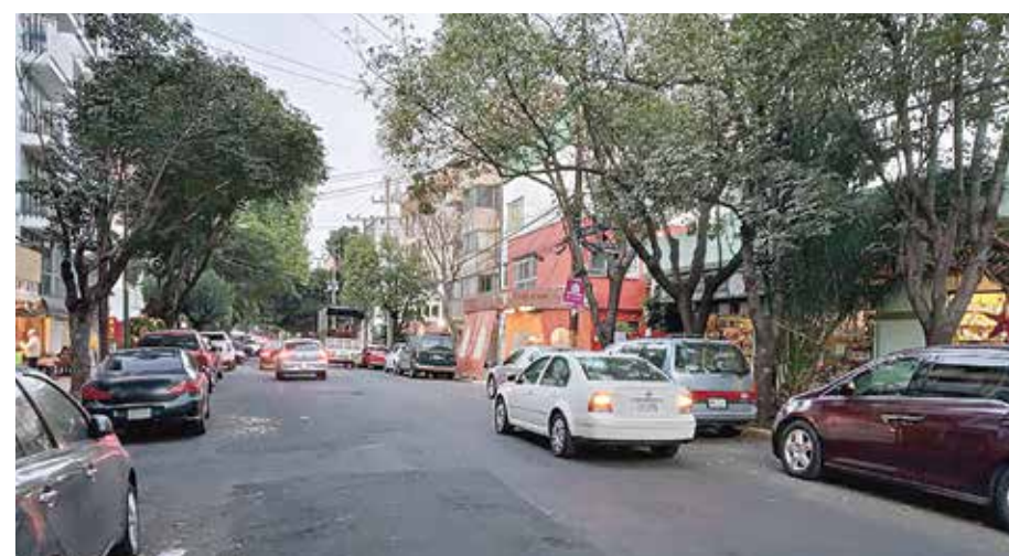
La calle Mier y Pesado, en el corazón de la Del Valle

En San Pedro de los Pirinos se optó por la numeración. Las vías que corren de Norte a Sur son avenidas; la dos, la cuatro, la seis. Y las que van de Oriente a Poniente, son calles: la uno, la tres, la cinco. La colonia está sin embargo delimitada por tres vías rápidas: Viaducto, Revolución y Patriotismo, así como el Anillo Periférico al Poniente. En cambio, la colonia Postal está integrada por calles cuyos nombres hacen referencia a esa actividad: Estafetas, Ahorro Postal, Giros Postales... y la del Periodista, por figuras dedicadas a esa profesión: