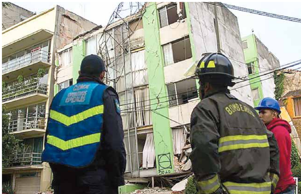
El edificio colapsado en Rebsamen 241

rollo Urbano y vivienda informó que las construcciones autorizadas se localizan en Edimburgo 4, colonia del Valle Centro; General Manuel Rincón 142, en la colonia General Pedro María Anaya; Es-