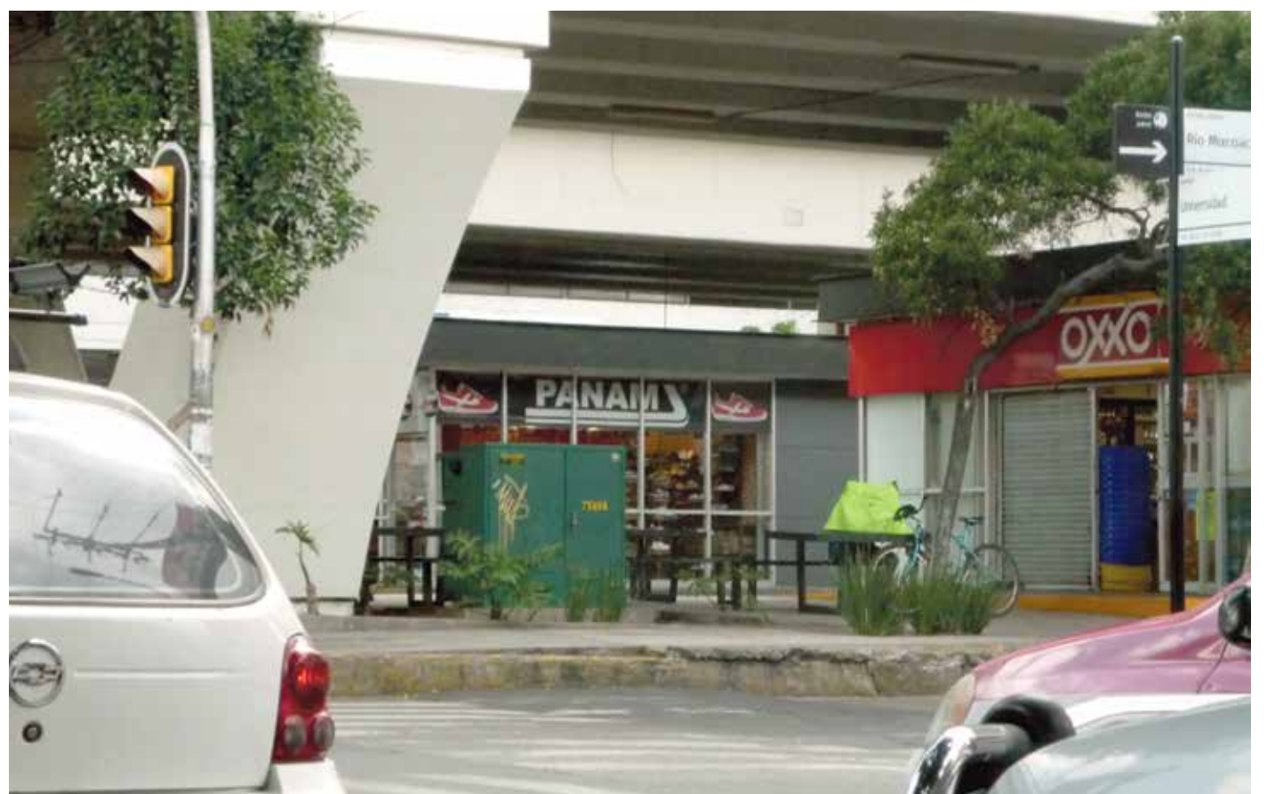
Negocios en bajopuentes

Dicha iniciativa propone que el permiso podría extenderse hasta por cinco años, siempre y cuando tenga como finalidad actividades culturales, educativas, deportivas, lúdicas, científicas en beneficio de la comunidad o bien proyectos para el desarrollo de la Ciudad de México, además de que todos ellos deben ser gratuitos.