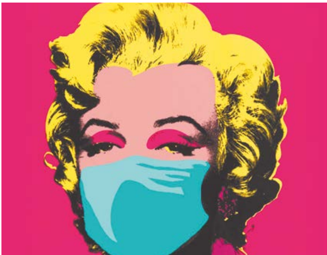
Mascarilla para "Marilyn Monroe", de Andy Warhol.