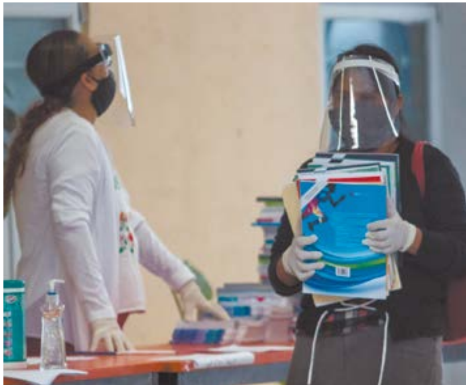
Entrega de libros de texto.

Hay además una extensa gama de pequeñas escuelas activas, preescolares, primarias, secundarias y preparatorias particulares, muchas de las cuales están ahora mismo en inminente peligro de desaparecer debido a una lamentable combinación de factores. ■