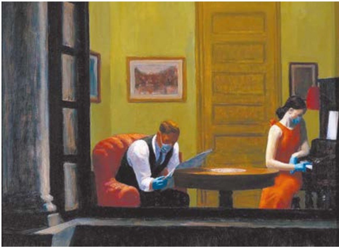
Mascarillas y guantes para "Cuarto en Nueva York", de Edward Hopper.

en bodegas remotas o regresar materiales en préstamo ante el súbito cierre de servicios aéreos y fronteras.