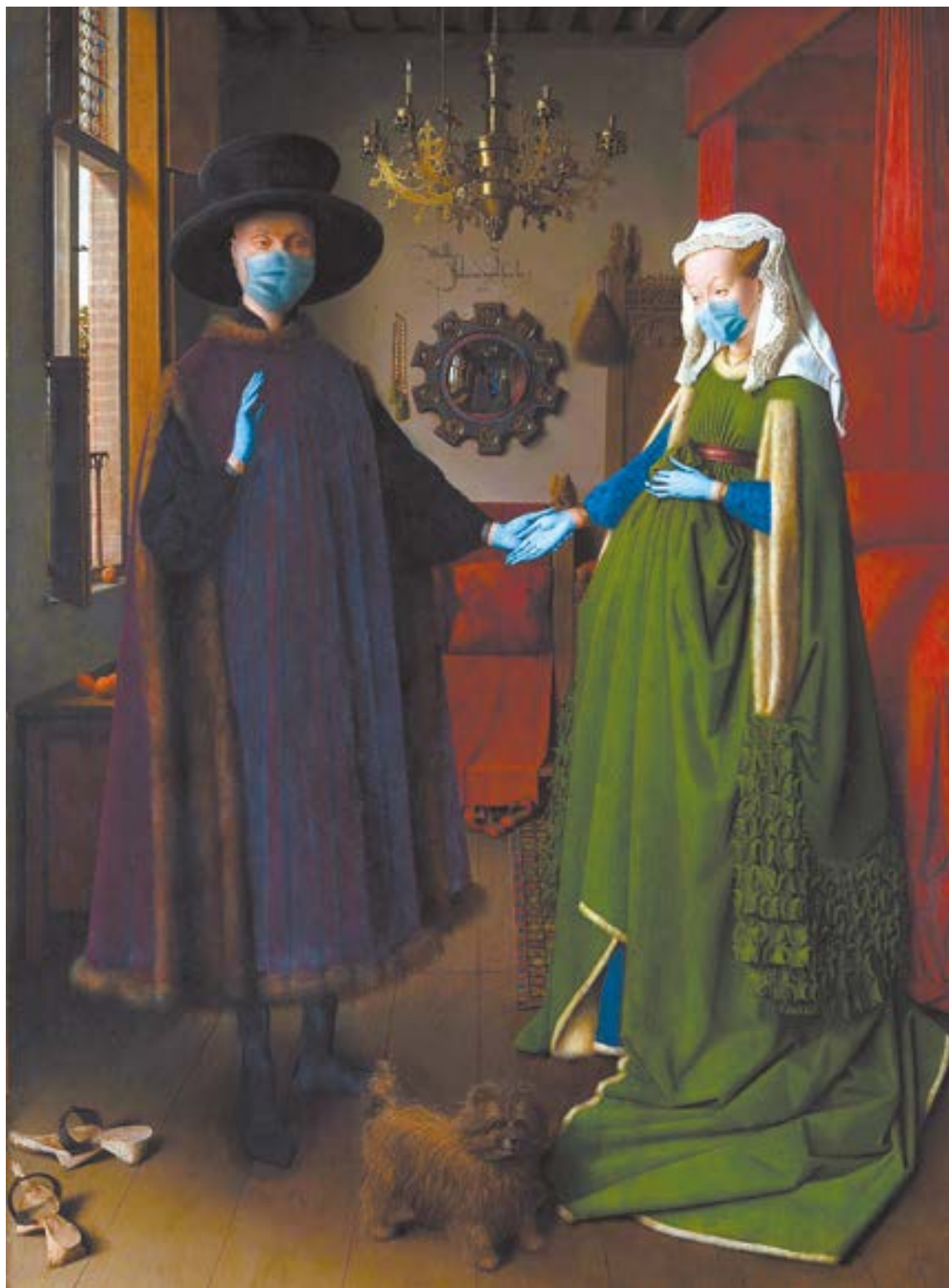
Mascarillas y guantes para "Retrato de Giovanni Arnolfini y su esposa", de Jan van-Eych.

En el siguiente ensayo, la maestra en museología por la Universidad de Harvard realiza un ejercicio sobre los retos que enfrenta el arte expuesto en museos y galerías.