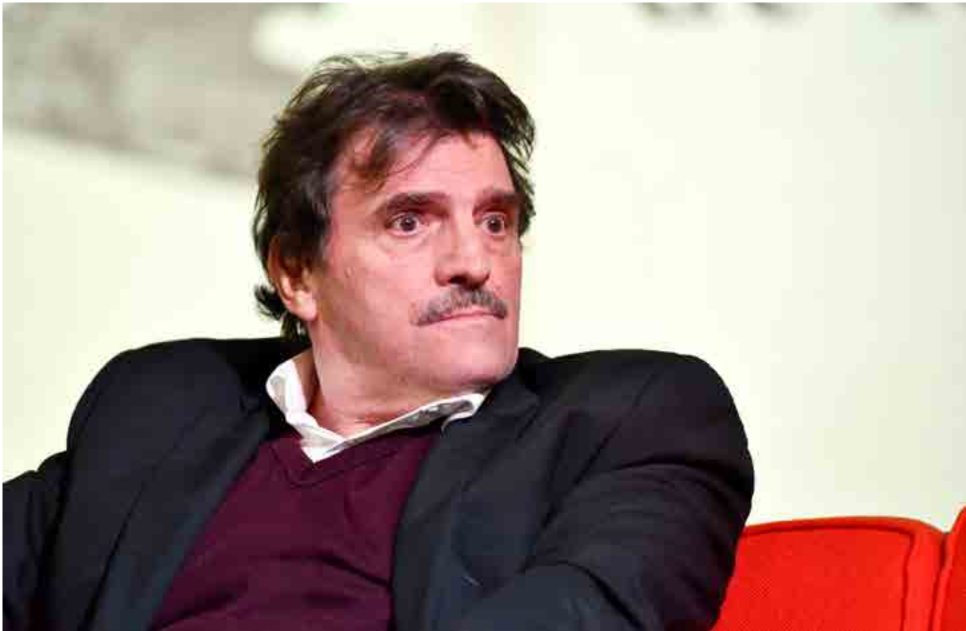
Mario Jasso / Cuartoscuro