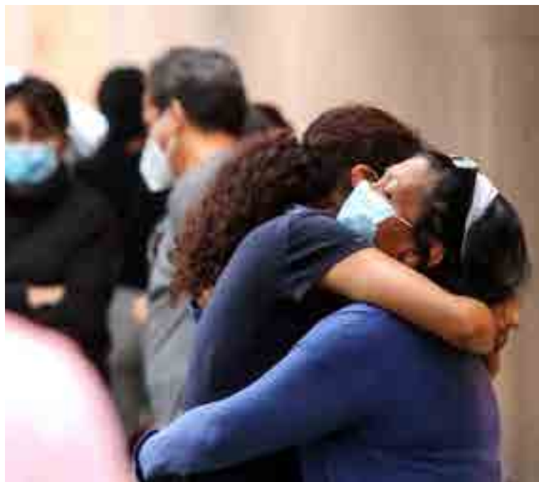
Rogelio Morales / Cuartoscuro