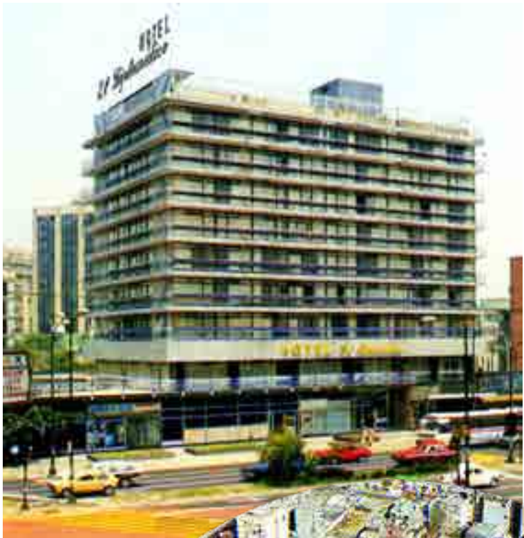
Col. Villasana-Torres / Facebook