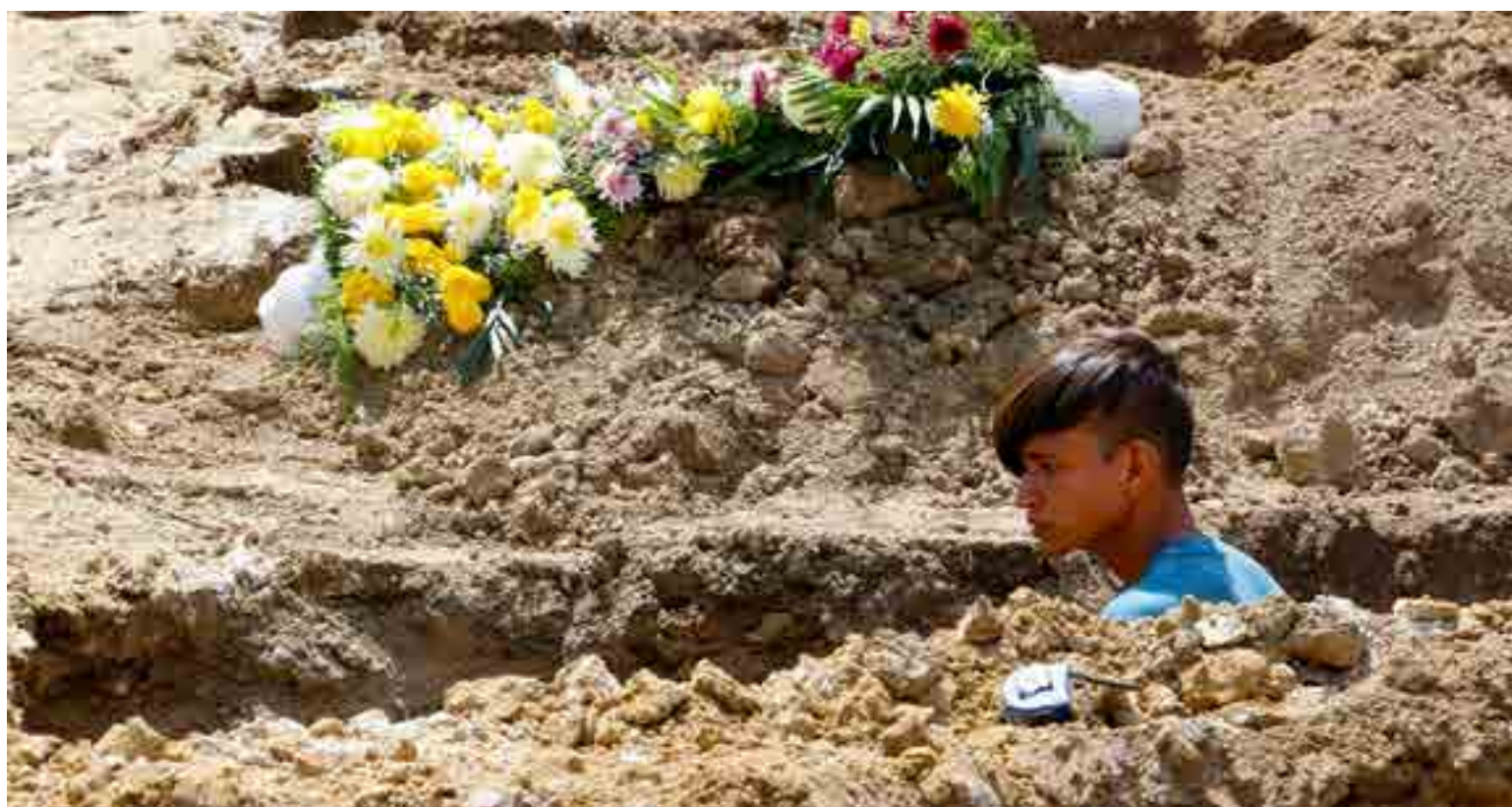
Fosas de muertos por Covid.

Uno de los objetivos de la nueva bancada panista, dijo, “será consolidarnos como un auténtico contrapeso real a los abusos y embates de Morena; ese será el legado que buscará dejar este numeroso Grupo Parlamentario para las futuras generaciones. Buscamos ser una oposición que funcione y sirva para las comunidades en sus retos más apremiantes”.