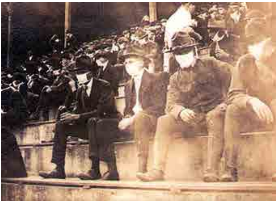
Espectadores en el Grant Field de Georgia, 1918.