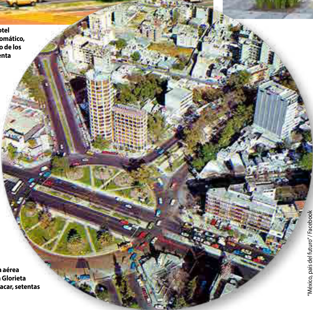
"México, país del futuro"