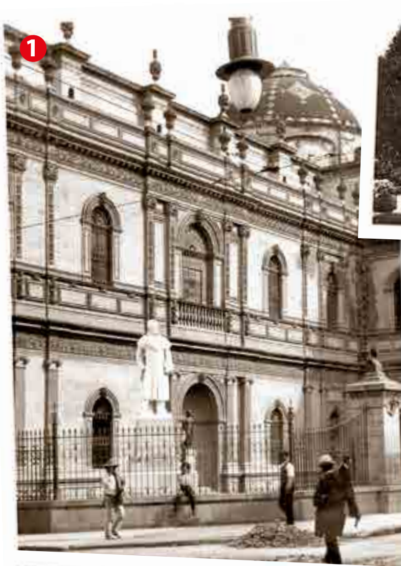
FOTO 1: Monumento a Alexander von Humboldt (regalo de Alemania) ubicado a las afueras de la Biblioteca Nacional en Calle Isabel La Católica. Autor: Hugo Brehme c. 1914

Aquí les presentamos tres imágenes de estos obsequios internacionales. Aún se pueden hoy visitar en la ciudad de México: