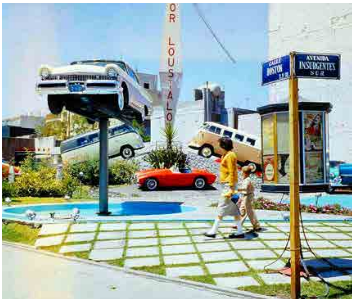
Colonia Nochebuena, imagen de los sesenta