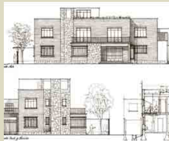
Los bocetos originales.

En 2010 el Ministerio de Cultura de España compró la casa a los hijos del cineasta por 400,000 euros, e invirtió en su remodelación. Se convirtió en 2013 en un centro cultural, conocido como Casa Buñuel o Casa Museo Luis Buñuel. Tras un conflicto de intereses entre los ministerios españoles de Cultura y Relaciones Exteriores, finalmente fue cedida al gobierno de México, que a la vez la entregó como su sede a la Academia Mexicana de Ciencias y Artes Cinematográficas.