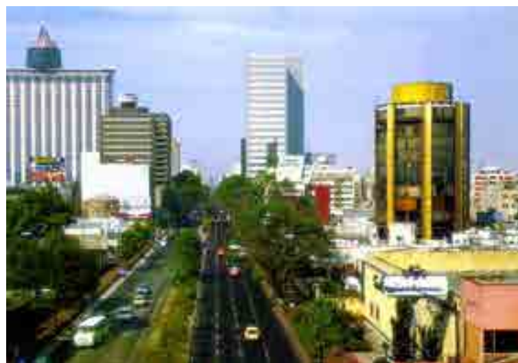
Del Valle y Nápoles, años ochenta