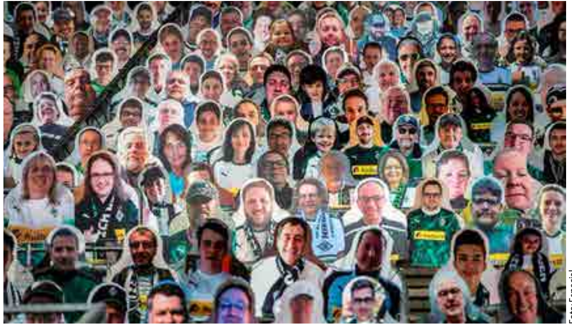
Espectadores de cartón.

En Estados Unidos, a pesar de la pérdida de casi 5 mil millones de dólares que sufrió la NFL, al final de la temporada pasada hubo una poderosa franquicia, dentro del mercado más pequeño de la liga, los Green Bay Packers, que registró un récord de ganancias durante este mismo periodo y lanzó un correcto mensaje de esperanza para los demás. Los Packers tuvieron ingresos anuales por 309 millones de dólares, lo que les representó un alza de 4.5% en com-