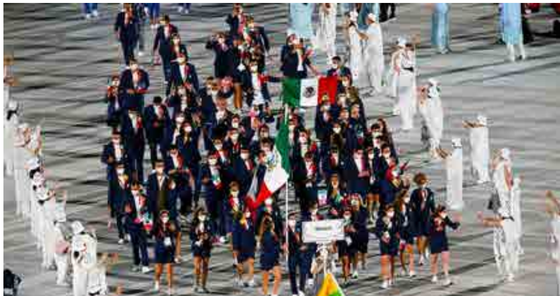
Delegación mexicana en Tokyo

El tema es que los futbolistas de la liga mexicana cada vez cargan mayor número de compromisos en las piernas y puede que debido