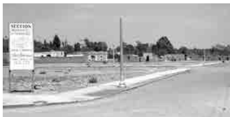
Esquina con Extremadura, donde estuvo un Sumesa y ahora hay un Toks