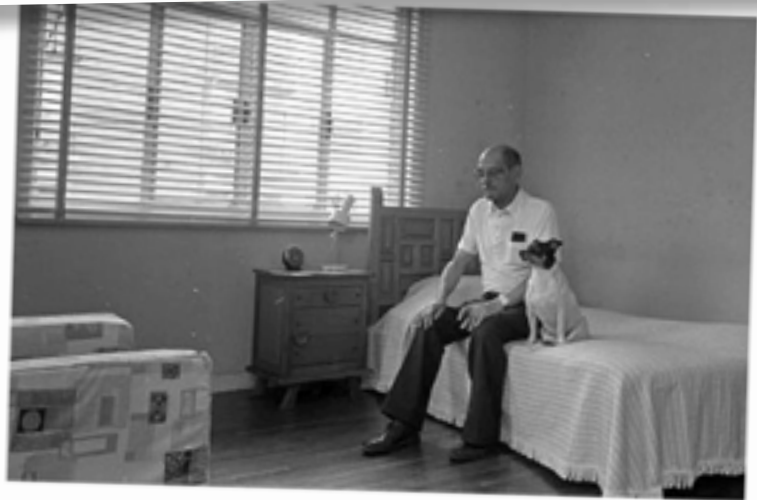
Buñuel en su cama con la perra Tristana, 1977.