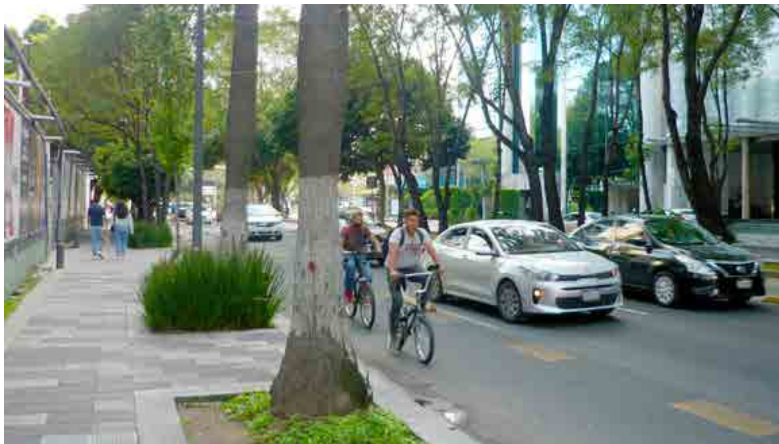
Peatones, ciclistas y automovilistas