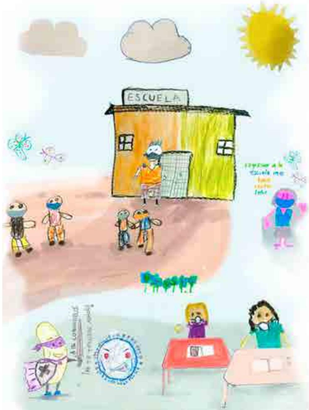
Dibujos que formaron parte de la consulta de CDHCM

“También se han realizado intervenciones indirectas mediante programas o acciones que, si bien no están dirigidas a la población infantil y adolescente, coadyuvan a generar condiciones menos adversas para las y los adultos cuidadores y las familias en general, lo cual tiene repercusiones positivas en el bienestar de las niñas, niños, y adolescentes”, reconoce el organismo. ■