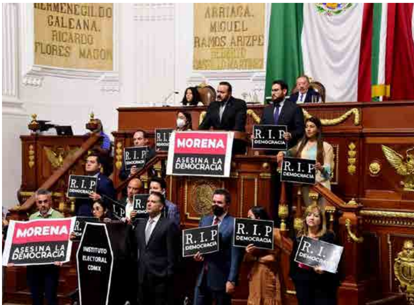
Protesta de la fracción el PAN.

Hace unos días, el Consejero del IECM, Mauricio Huesca, denunció que el Instituto no tienen ni siquiera para imprimir boletas electorales para las elecciones de 2024. Que el Gobierno de la Ciudad está ahorcando a la máxima autoridad electoral de la ciudad, pretender organizar ellos las elecciones para que no haya árbitro y nadie pueda frenar sus irregularidades y arbitrariedades.