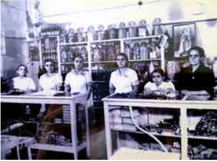
Empleadas del pasado, mismo aparador.