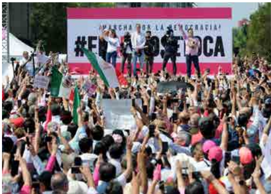
Se anuncia nueva marcha en favor del INE.

Diputados del PAN de Ciudad de México refrendaron su compromiso con la pluralidad, contra el sectarismo y en defensa de las instituciones democráticas.