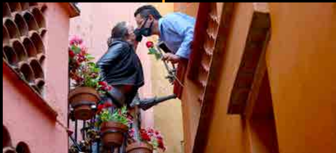
Andre Murcia / Cuartoscuro