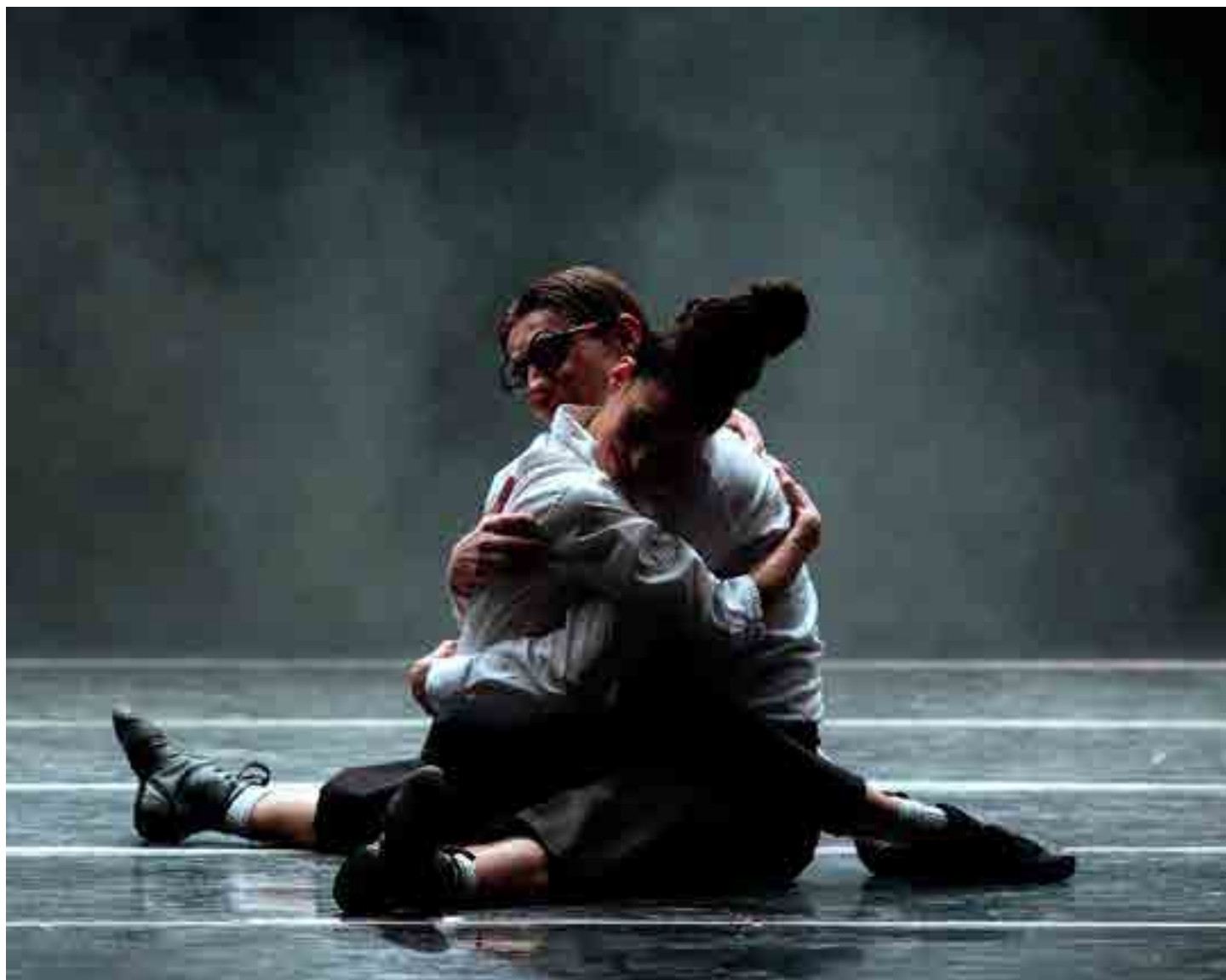
‘El balcón del amor’

Así que, sin otra brújula que la propia intuición y los consejos de otros viajeros que han recorrido esa distancia algo más que nosotros (y a veces menos), emprendemos el viaje sin retorno, confiados en que alguien nos espera, en alguna parte, a lo largo del camino.