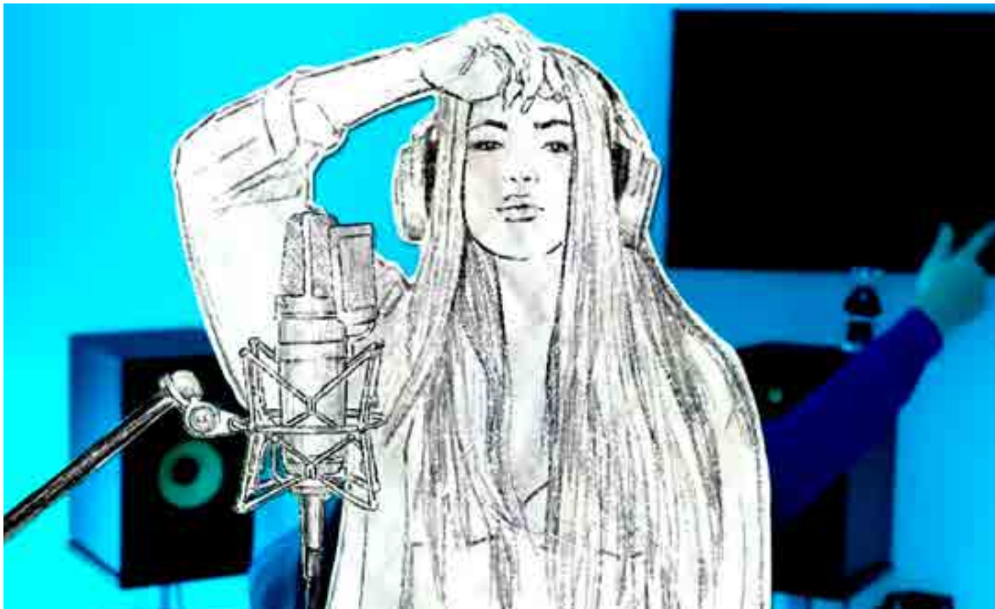
El video Shakira BZRP Music Sessions #53

Y fue así que Shakira lanzó su canción de despecho, en la que se pone muy por encima de su rival en amores: es un potente automóvil Ferrari en comparación con el modesto Twingo,