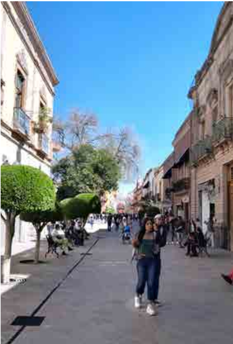
Patrimonio de la Humanidad