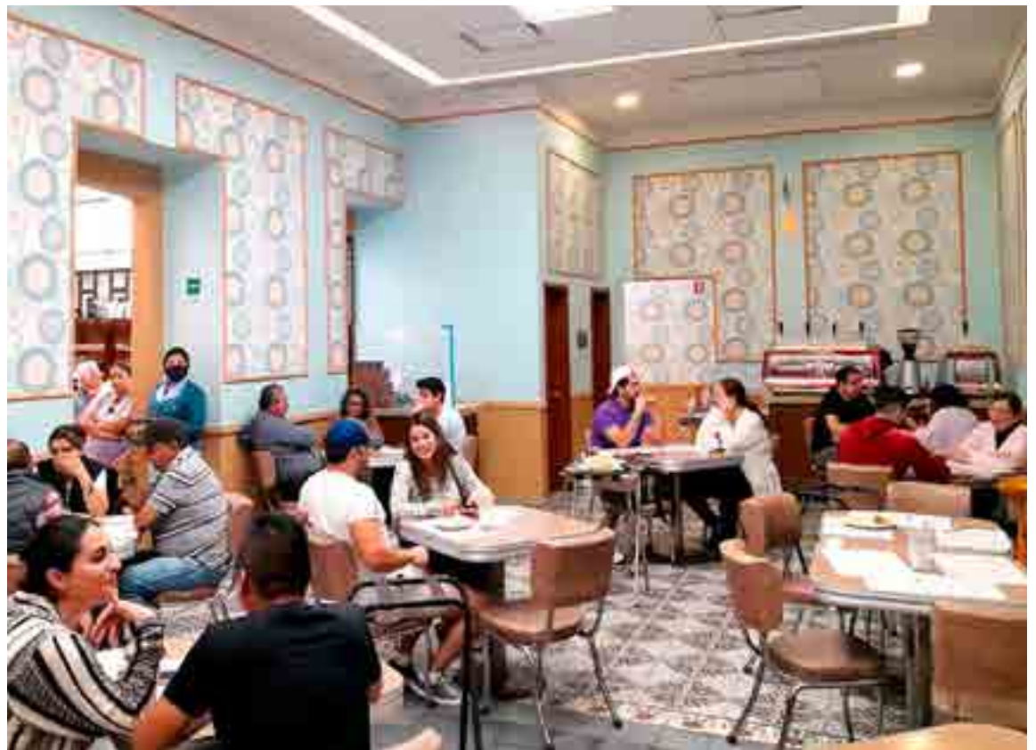
El salón de La Mariposa.

negamos a cambiarles el nombre”. También son clásicos los molletes con salsa verde, los huevos rancheros, los tacos que se sirven en forma de dobladas. Y por supuesto, el café lechero y las malteadas. Su pan en telera es inimitable. Toda la vajilla – hasta los vasos de vidrio– tiene estampada la mariposa. Esa misma mariposa que no se sabe de dónde vino. ☐