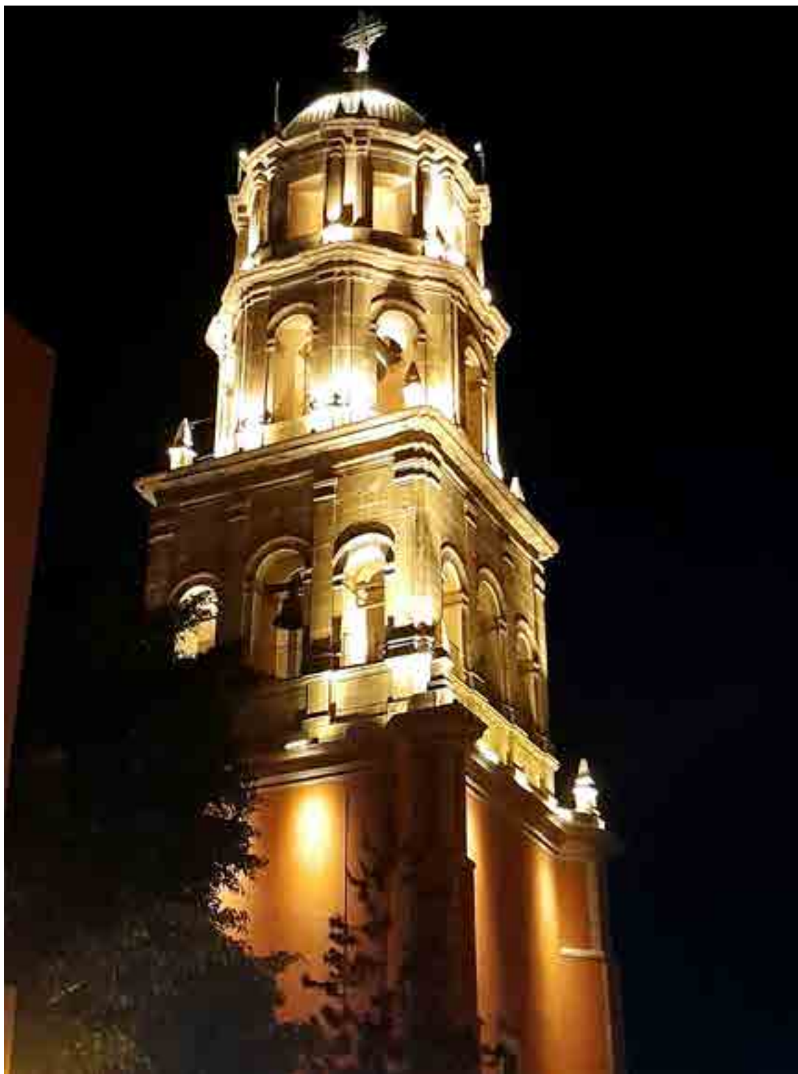
Torre del templo de San Francisco.

Antes del café, los helados, los dulces y los pasteles que le han