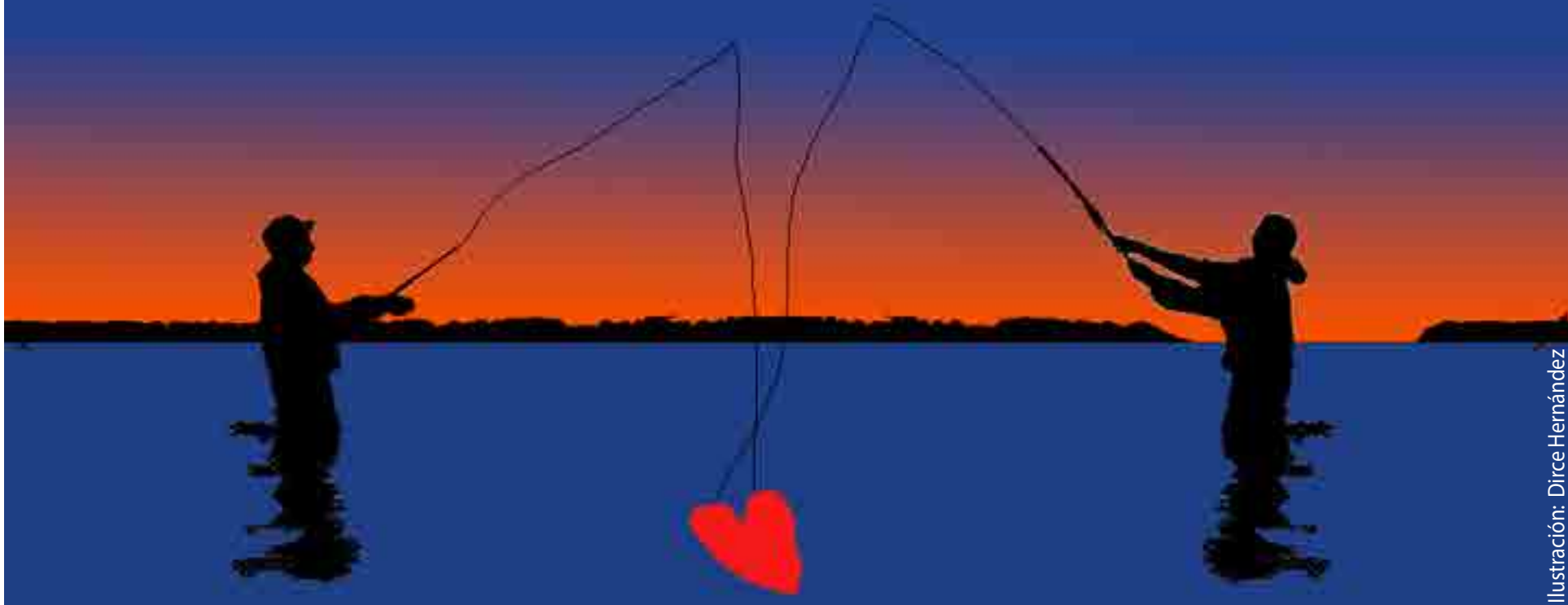
Ilustración: Dirce Hernández